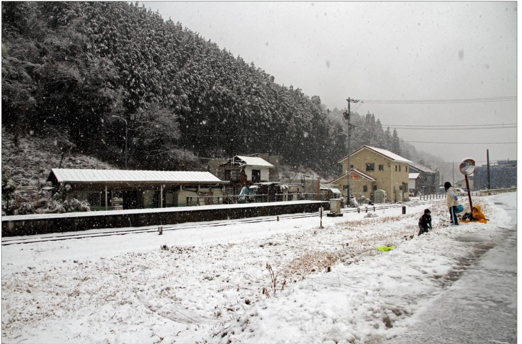
土手で遊ぶ子らが雪だるまを作った…平成26年2月8日