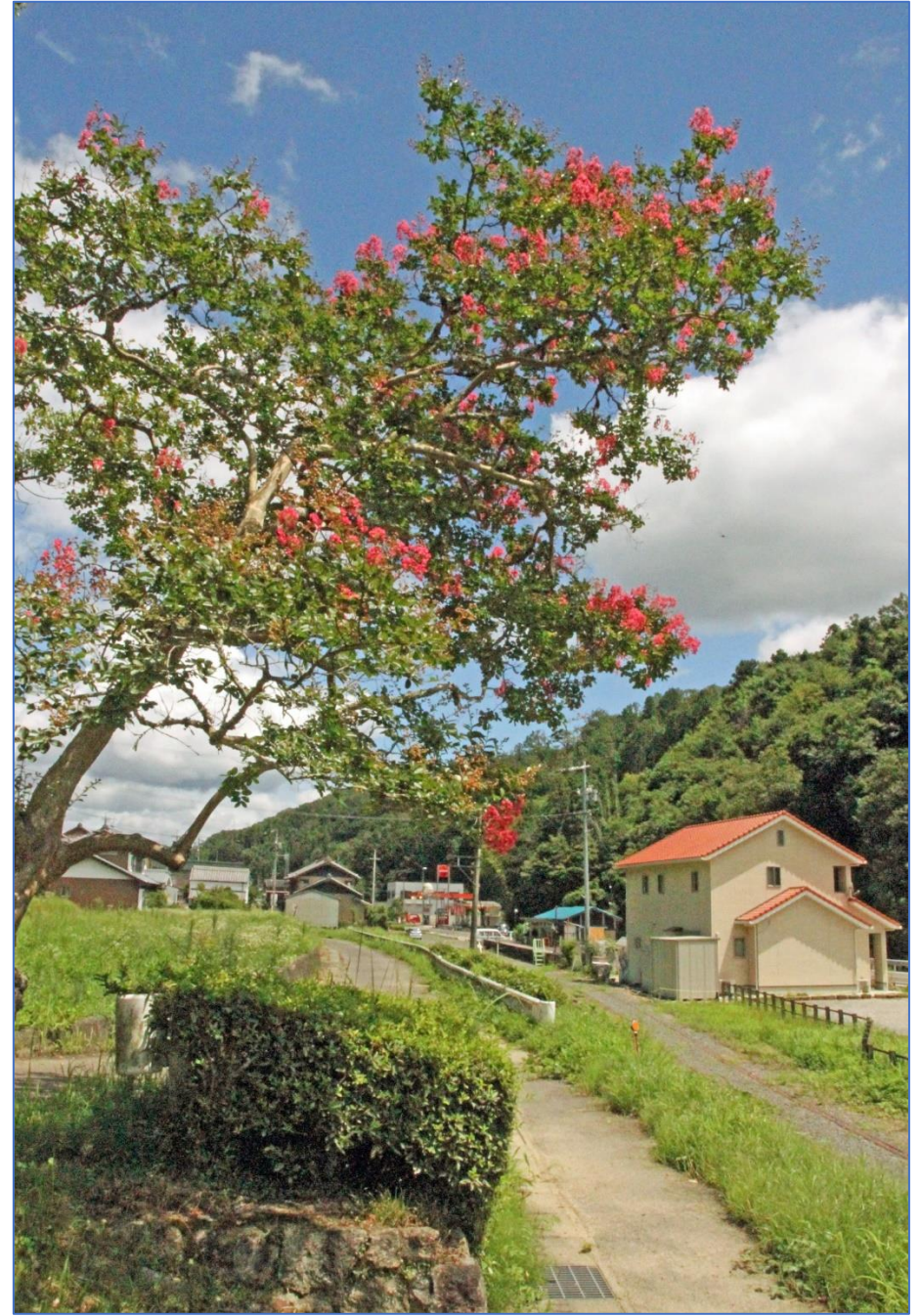
岩倉神社前の百日紅…平成 19 年 8 月 30 日