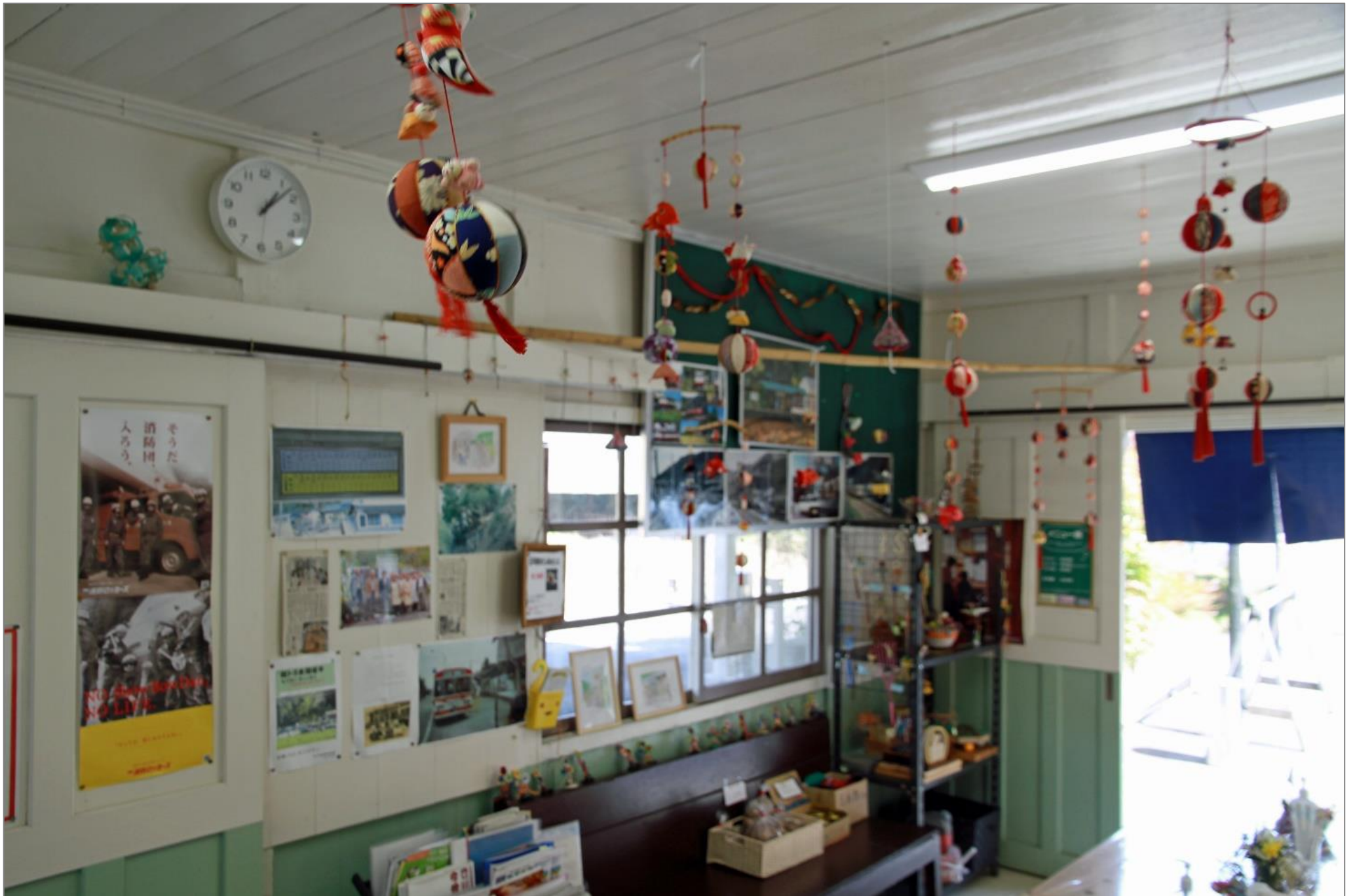
西中金駅舎内吊るし雛でいっぱい…令和5年3月11日