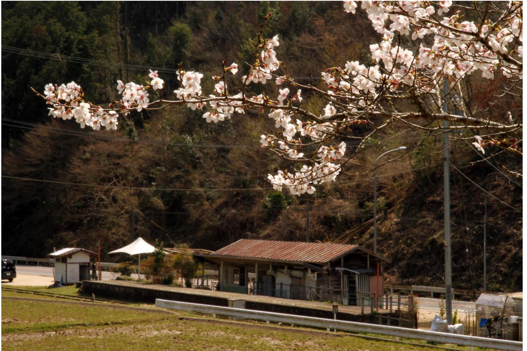
岩倉神社境内から西中金駅跡を臨む…平成 26 年 4 月 3 日