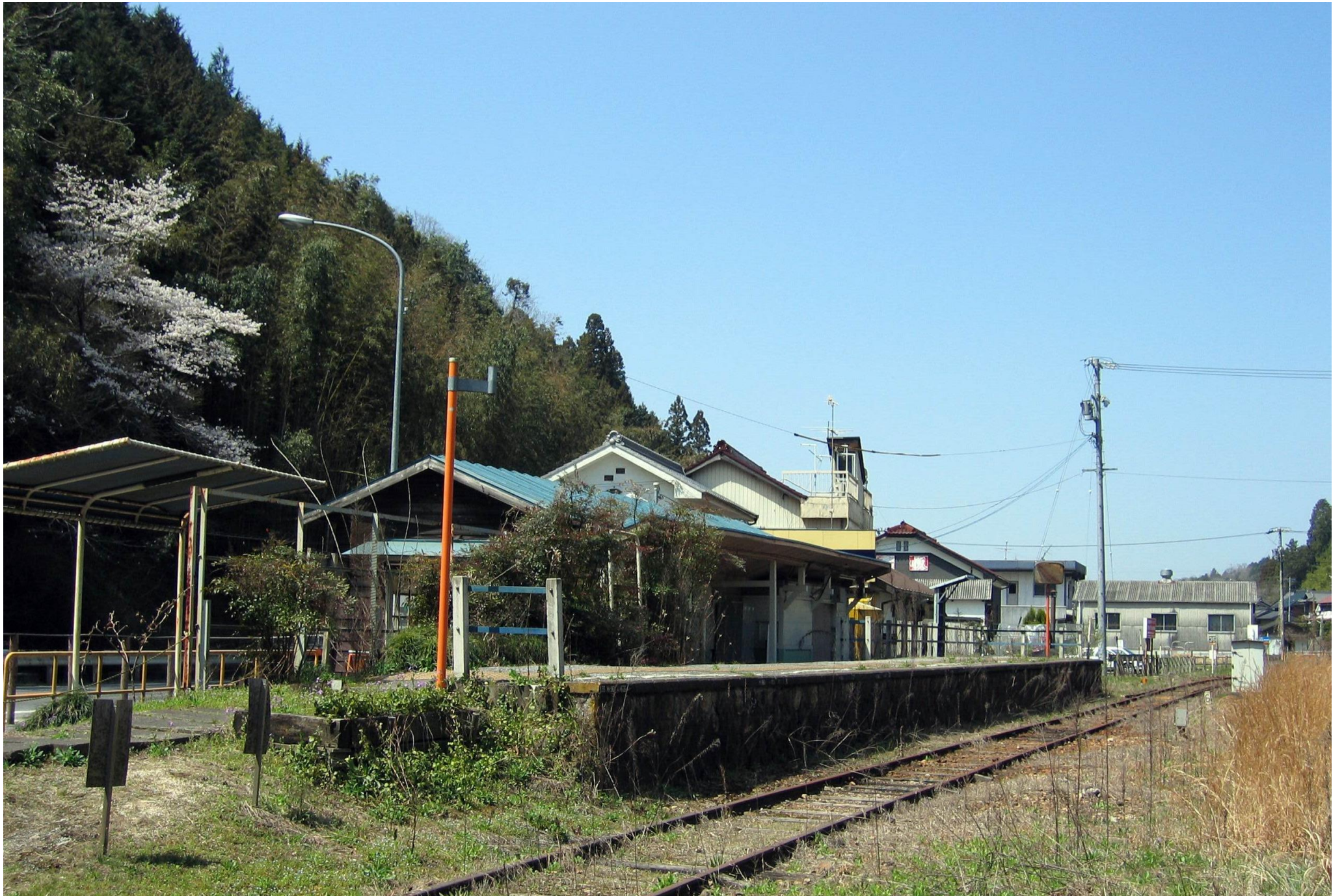
写真は…平成 17 年 4 月 9 日