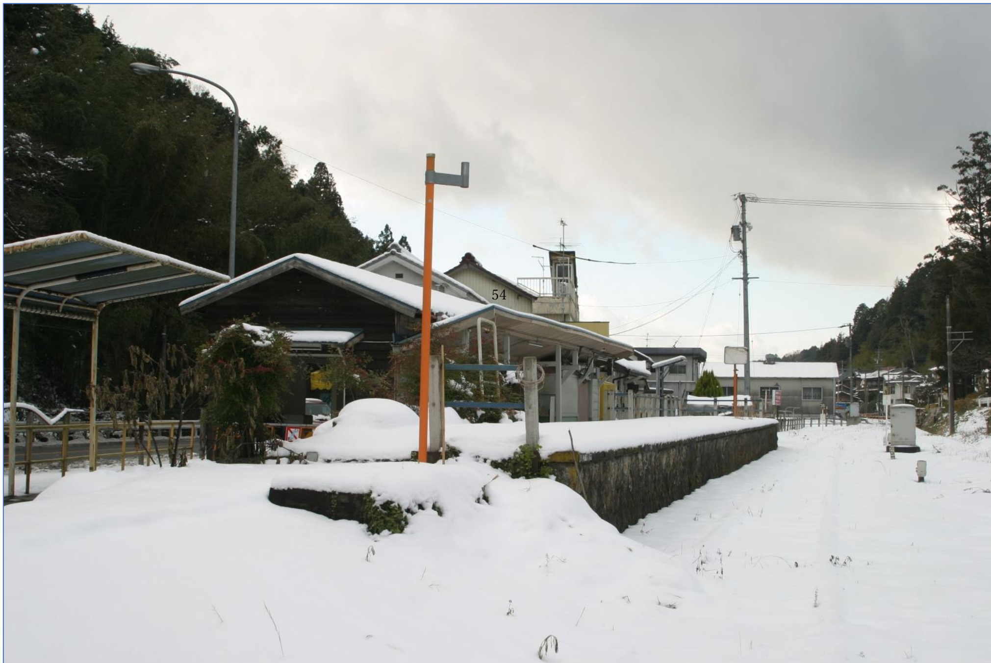
三河線の山線では大雪。名古屋では 58 年振り的大雪とか…平成 17 年 12 月 19 日